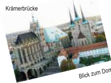
Blick zum Dom