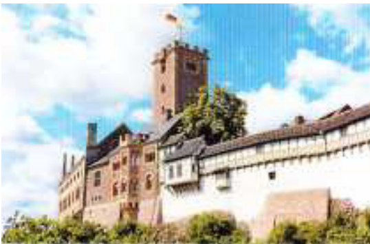
Die Wartburg in Eisenach