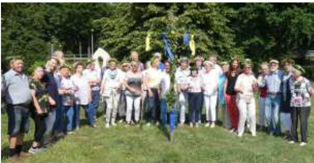
Sommerfest 2019 - mit dem Tanz um den „Maibaum“

Termin vormerken! Persönliche Einladungen folgen.